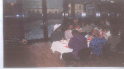
رئيس الجمعية السودانية مع القيادات الشبابية المشاركة في المؤتمر من جنوب السودان ، بالنرويج ، 2005م .