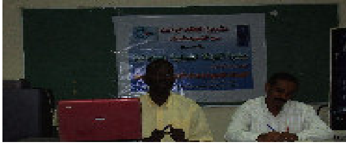
ورشة عمل القيادات الشبابية وMDGs بالتعاون مع UNDP بمباني جامعة الاحفاد للبنات ، اغسطس 2006م.