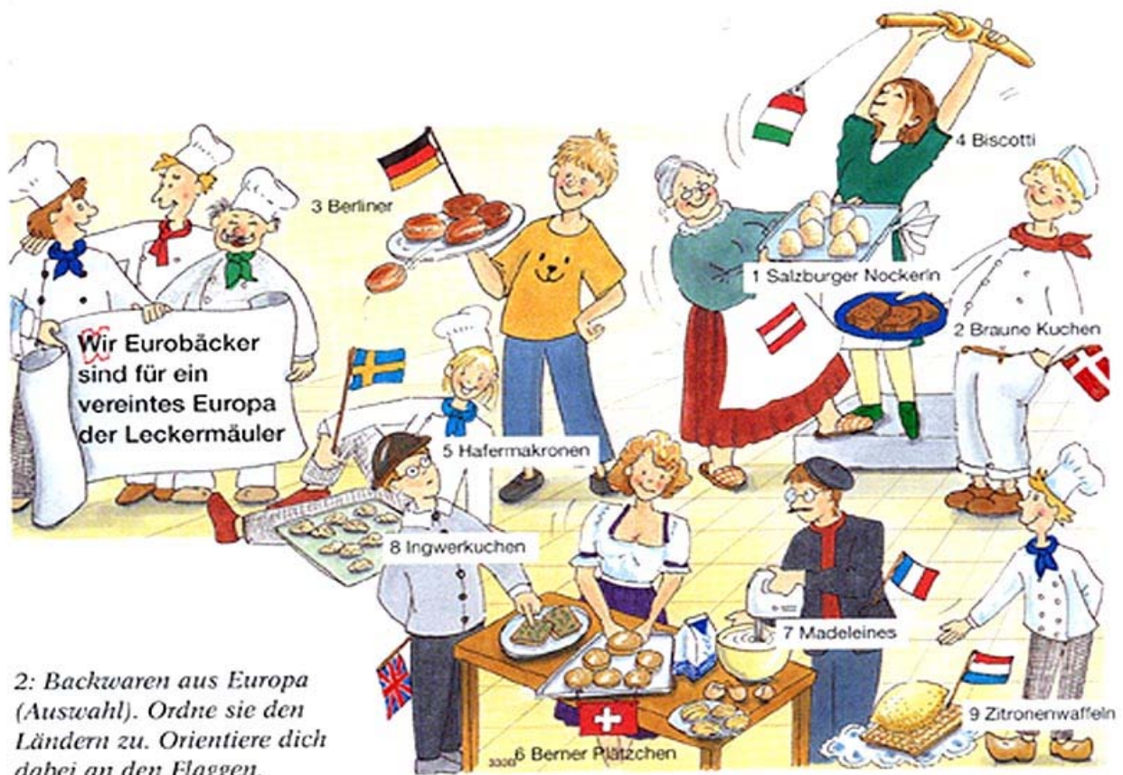
2: Backwaren aus Europa (Auswahl). Ordne sie den Ländern zu. Orientiere dich dabei an den Flaggen.

Aber genug davon, ich hab ja noch mehr zu erzählen. Ich glaube, wir sind jetzt soweit, dass wir uns mit den Begriffen „persönliche Identität“ beziehungsweise „kulturelle Identität“ beschäftigen können. Zunächst einmal kann man sagen, dass jeder Mensch eine einzigartige, eben eine ganz persönliche Identität hat, wodurch er sich von anderen Menschen unterscheidet. Dies kann man sich so vorstellen: Die Summe aller Werte, Einstellungen und Verhaltensweisen, die ich habe oder zeige und deren genaues Verhältnis zueinander (was ist mir am wichtigsten und was ist mir nicht so wichtig?) - diese Kombination ist bei keinem anderen Menschen noch einmal genauso vorhanden und genau diese einmalige Mischung macht meine persönliche Identität, meine Individualität aus! Auf der anderen Seite gibt es aber natürlich auch Gemeinsamkeiten zwischen den Menschen. Betrachtet man diese und nicht die Unterschiede, dann kann man mehrere Menschen anhand bestimmter Merkmale zu einer Gruppe zusammenfassen. Man kann dann sagen, dass sie eine gemeinsame Gruppenidentität haben beziehungsweise sich eine kulturelle Identität teilen. Ihr werdet jetzt bestimmt einwenden, dass man ja fast unendlich viele Gruppen bilden kann und dass deshalb dieses Gerede über Identität ganz schön schwammig ist. Und damit habt ihr auch Recht. Aber nichtsdestotrotz ist es eine Tatsache, dass es gewisse Gruppen gibt, die einfach eine Rolle in meinem Leben spielen.