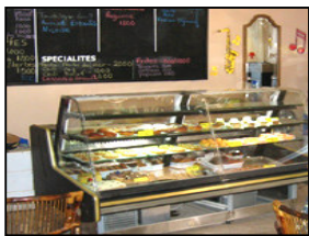
Celebration Baked Goods à Kaolack

qui n'ont jamais été à l'école. Les recettes des deux entreprises susmentionnées sont utilisées pour financer les activités du centre d'enseignement.