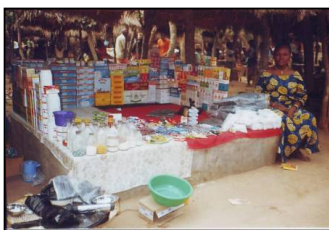
Essénam étale sa gamme de produits variée

Il y a de cela deux mois, Essénam a franchi ce premier pas par le biais de Kiva.org, un portail d'accès à des micro-crédits reliant les entrepreneurs qui recherchent des fonds à des personnes disposées à leur prêter de l'argent. Pour ce qui concerne Essénam, 35 individus vivant au Canada et aux