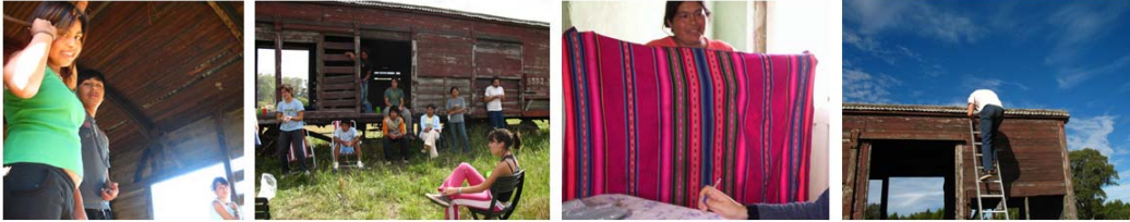
Alianza LoCurativo · Un Vagón Hermoso

Una escala posible de proyecto social y cultural, basado en la educación popular y el encuentro de saberes académicos y culturales en un pequeño pueblo de inmigrantes, al sur de la provincia de Buenos Aires.